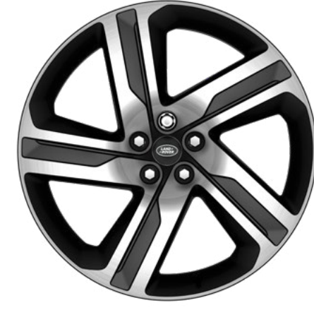
22" style 5124, Gloss Dark Grey, finition Diamond Turned