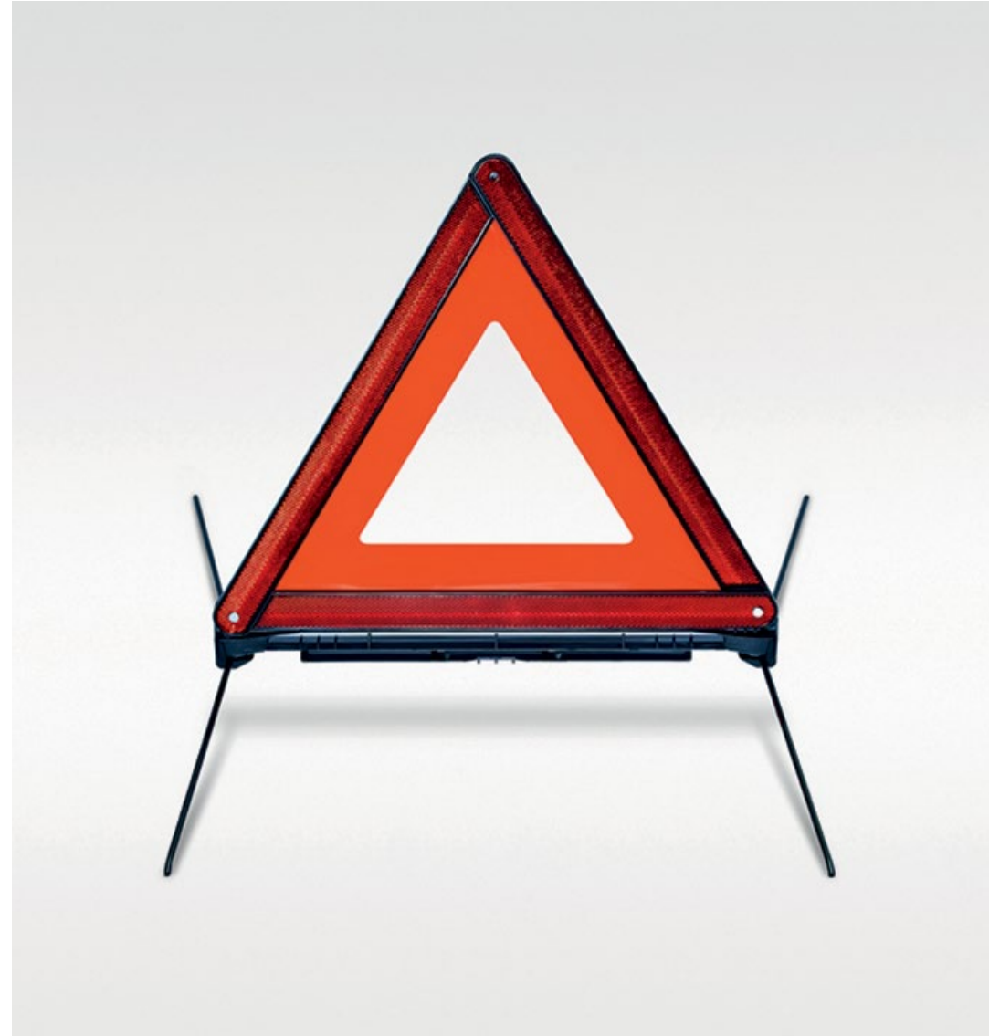
Triangle de signalisation

Extincteur à poudre sèche, fourni avec support de fixation.