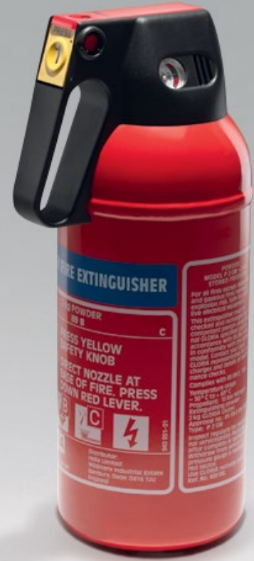
Extincteur - 1 kg

Extincteur à poudre sèche, fourni avec support de fixation.