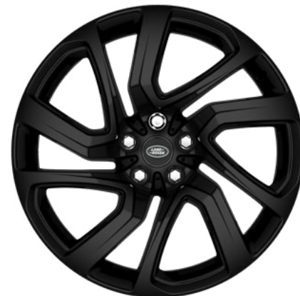
21" style 5025, Gloss Black