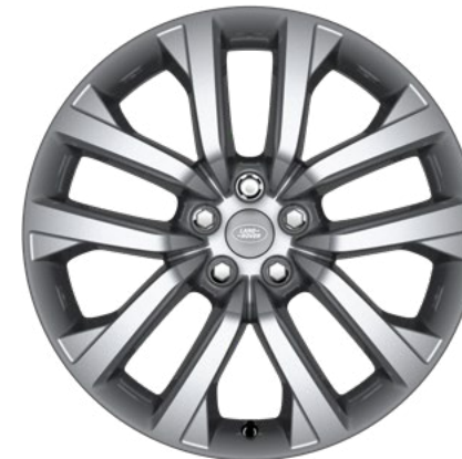
21" style 5123, Sparkle Silver