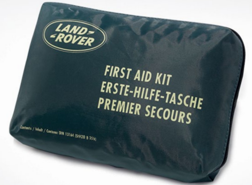
Trousse de premiers secours

Vital en cas d'urgence. Se range dans le compartiment à bagages.