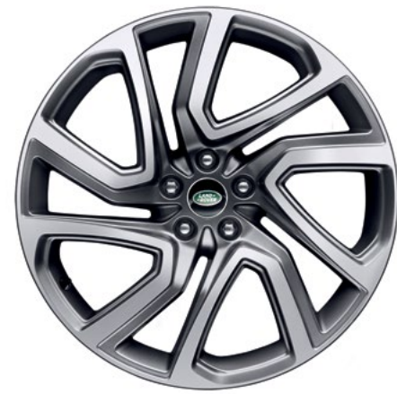
22" style 5025, Light Silver, finition Diamond Turned