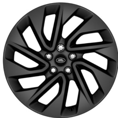
20" style 5122, Satin Dark Grey