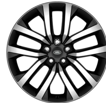
21" style 5123, Gloss Dark Grey, finition Diamond Turned