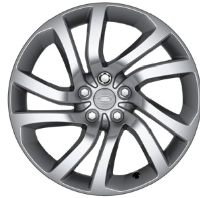
20" style 5011, Sparkle Silver