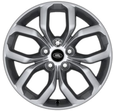
19" style 5021, Sparkle Silver

Personnalisez votre véhicule avec une sélection de roues en alliage léger à choisir parmi un large éventail de designs contemporains et dynamiques.