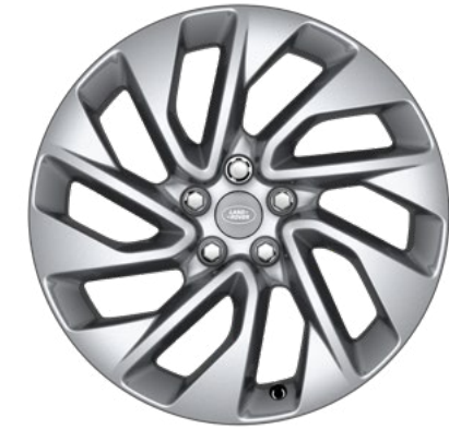
20" style 5122, Sparkle Silver