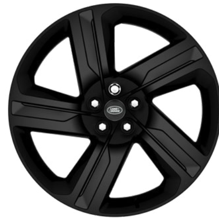
22" style 5124, Gloss Black