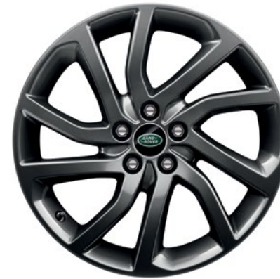
20" style 5011, Satin Dark Grey