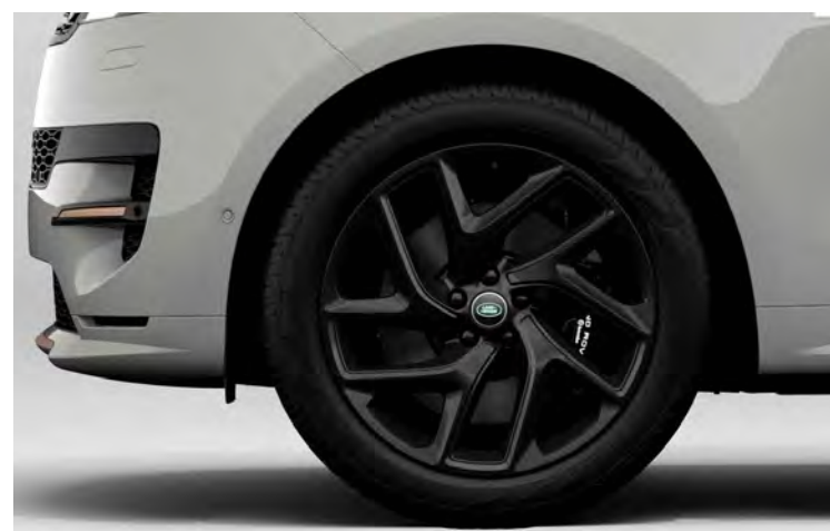
22" SV BESPOKE 5-SPLIT SPOKE 'STYLE 5131' SATIN BLACK & CONTRAST GLOSS BLACK