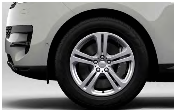
20" 5-SPLIT SPOKE 'STYLE 5134' GLOSS SPARKLE SILVER