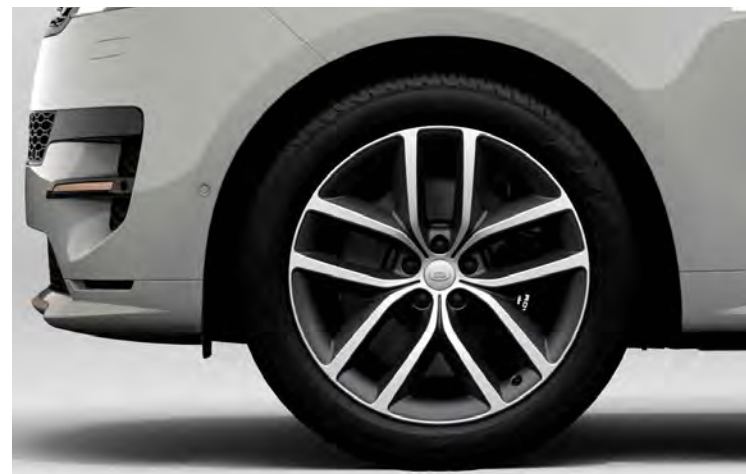
22" SV BESPOKE 5-SPLIT SPOKE 'STYLE 5127' DIAMOND TURNED FINISH & CONTRAST SATIN DARK GREY