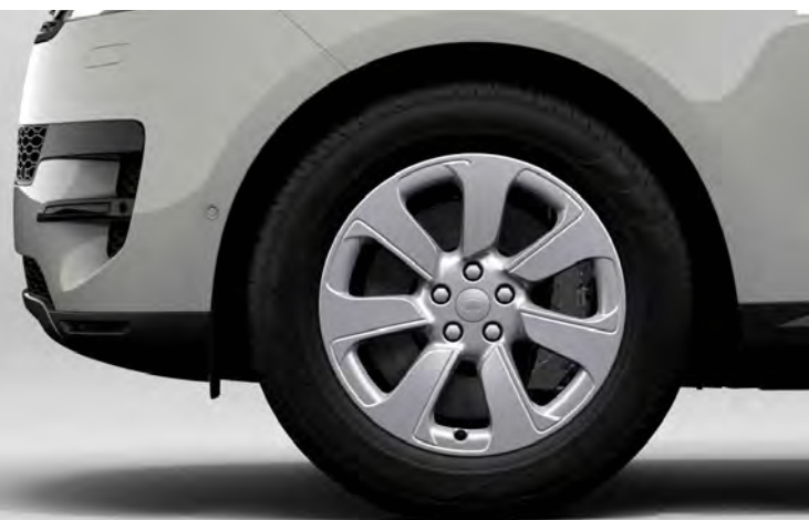
20" 7-SPOKE 'STYLE 7020' GLOSS SPARKLE SILVER