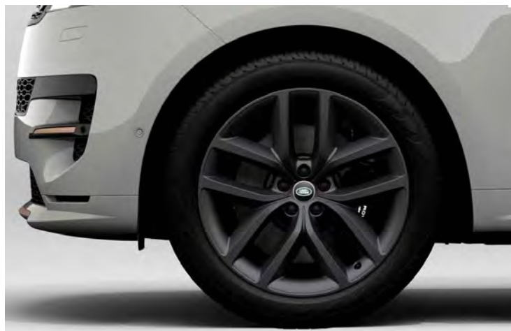
22" 5-SPLIT SPOKE 'STYLE 5127' SATIN DARK GREY Standaard op Range Rover Sport Dynamic HSE